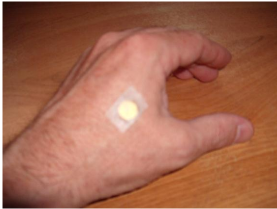
Positionnement d'un aimant sur le point 4GI

Vous pouvez également positionner un aimant la face Sud sur le point HE GU , grand point de commande de la face (4GI : sur le milieu du 2 o métacarpien, sur sa face radiale), comme le montre l'illustration ci-dessous :