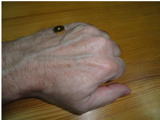
Positionnement d'un aimant sur le point 3TR

Ou aussi sur le point ZHONG ZHU (3TR : sur le dos de la main, dans un creux entre 4 o et 5 o articulation métacarpo-phalangienne), grand point distal pour traiter les problèmes d'oreille, notamment dans les signes inflammatoires, comme illustré sur la photo ci-dessous :